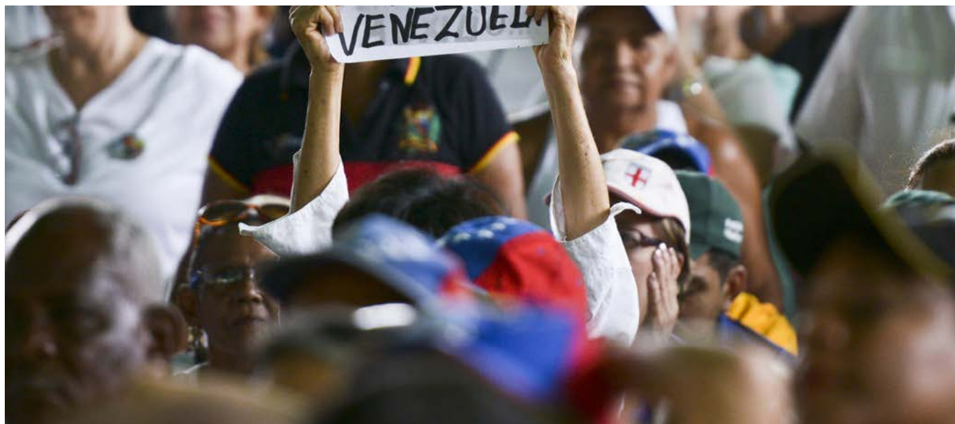
Venezuela continua en un escenario de incertidumbre política y crisis económica.

Otro de los tantos retos que los venezolanos le conceden a la Asamblea