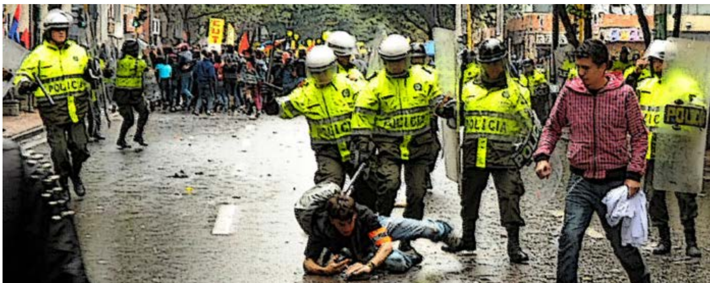
La libertad de prensa se vió amenazada durante el primer mandato de Santos. Las agresiones e intimidaciones fueron numerosas.

El periodismo, en sociedades democráticas, representa una de las manifestaciones más importantes de la libertad de expresión e información. De ahí que este artículo se dedique a revisar las garantías que tuvo la prensa durante el primer periodo de gobierno de Juan Manuel Santos y los retos que enfrenta el Gobierno en este sentido en su nuevo mandato.