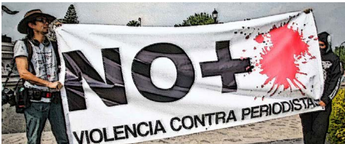
En un contexto de violencia e inestabilidad la prensa es un objetivo estratégico para quienes intentan controlar la información.