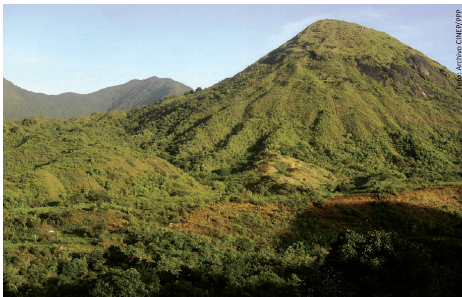
Proyecto Los Ciruelos pone en riesgo el frágil ecosistema conocido como bosque seco tropical.

El presente artículo presenta la trayectoria de los diferentes proyectos