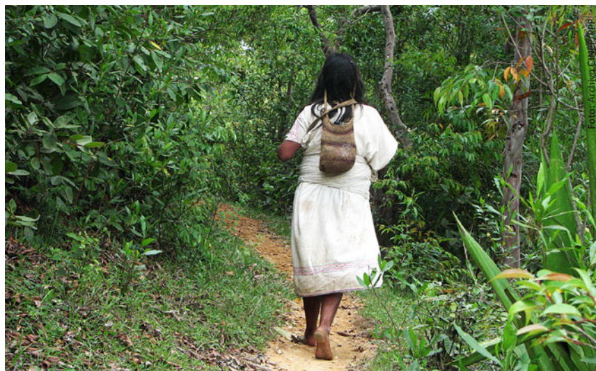
Los sitios sagrados de estas comunidades no pueden ser visitados por turistas hasta que no se adelante la consulta previa.

A pesar de que este proyecto ha sido liderado por la reconocida cadena hotelera Six Senses, líder en el mundo en el desarrollo de