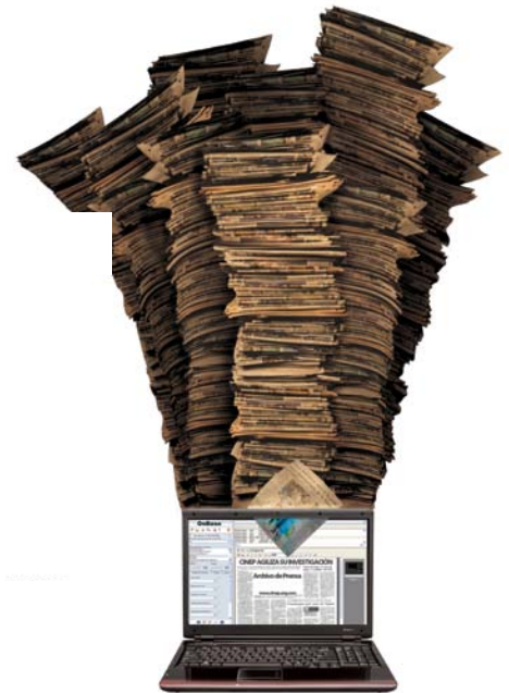
ARCHIVO DE PRENSA CINEP/PPP Toda la información que usted necesita como investigador en problemáticas sociales, en un sólo click.

Por ejemplo, el invierno demostró que con las variaciones climáticas se profundiza la vulnerabilidad de los sistemas de asenta- mientos por lo que se hace necesario reasig- nar muchos de los recursos para otro tipo de funciones. Pero tan sólo el reparar las vías va a absorber todos los recursos y la regla fiscal impondrá topes que impedirán que se asig- nen otros que se necesiten.