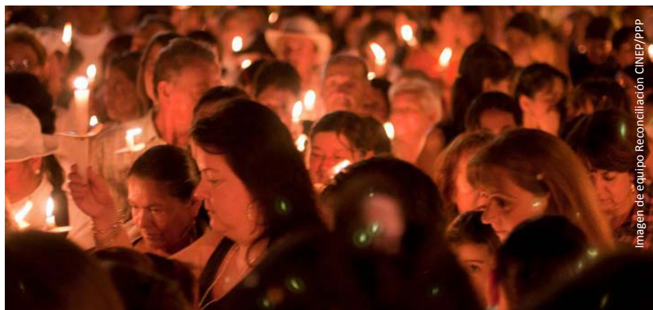
Imagen de equipo Reconciliación CINEP/PPP

La paz que hasta ahora parece querer el gobierno de Santos se limita a la desmo-