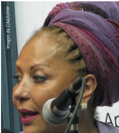
Las últimas liberaciones de secuestrados, facilitadas por la ex senadora Piedad Córdoba, evidenciaron que aún reina la desconfianza ante las FARC por parte del Estado y la sociedad civil.

“ En diversas regiones del país, incluyendo varios centros urbanos, los hechos de violencia han hablado con contundencia en el último año y medio ”.