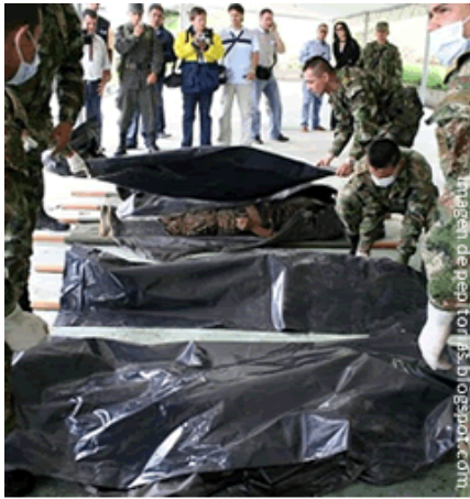
El total de guerrilleros abatidos por la Fuerza Pública en el 1er semestre de 2010 fue de 297

sumó 297, y desde el año 2002 a la fecha el total de subversivos dados de baja es de 13.007, lo que equivale a un nivel de letalidad en términos de bajas del 8%. Teniendo en cuenta lo anterior, y si se acepta que el número total de guerrilleros actualmente es de aproximadamente 10.000 combatientes, encontramos que por cada guerrillero hay 28 soldados y, sin embargo, los golpes de la guerrilla llevaron a que la Fuerza Pública recibiera un total de 204 muertos y 1.043 heridos en los últimos seis meses.