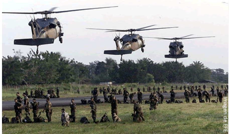
Tras ocho años de la copolítica de seguridad democrática sus resultados operacionales no son tan grandes como lo reclama el gobierno, pero tampoco tan desdeñables como lo reclama la oposición.

Según cálculos ponderados, para el año 2002 el número de guerrilleros de las FARC y el ELN sumaban alrededor de 20.600 combatientes. De acuerdo con el Ministro de Defensa Gabriel Silva, a julio de 2010 son menos de 10.000 miembros. Sin embargo, la suma total de guerrilleros reinsertados, capturados y dados de baja según el mismo Ministerio de Defensa, entre enero de 2002 y junio de 2010, sumó un total de 69.273 personas 3 . Esta cifra suscita diversos interrogantes y dudas. De ser